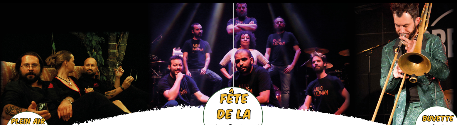
© Marc Bonnetain - Alexandre George